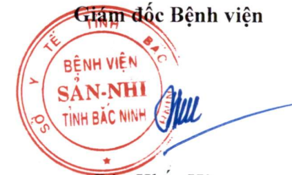
Đào Khắc Hùng